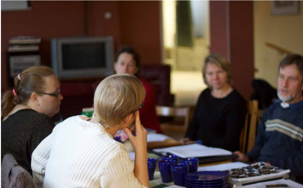
Möte i styrgruppen.