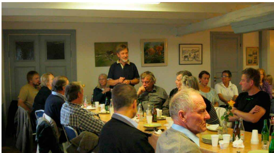
Diskussionerna flödar på Gyllene Brunnen.