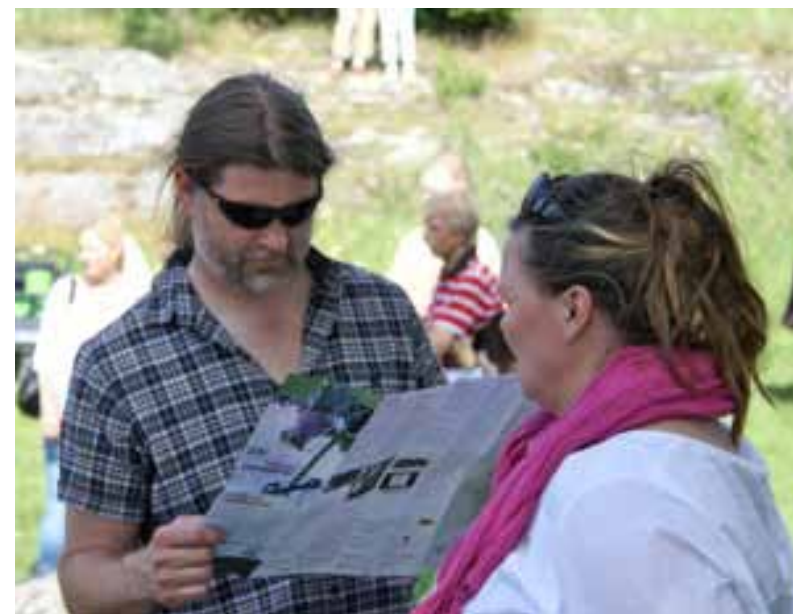
Turistkartan över Fjärdhundrabygden delades ut gratis till intresserade besökare.

Följdriktigt heter därför den turistkarta som arbetats fram inom projektet Fjärdhundrabygden turistkarta . Grundkarta är lantmäteriverkets terrängkarta, som är mycket detaljerad och gör det lätt att hitta även de minsta vägarna och stigarna. På den har det lagts in cykelslingor, vandringsleder, bygdens sevärdheter samt de entreprenörer med anknytning till besöksnäringen som valt att annonsera på kartan. Själva underlagsarbetet gjordes inom projektet Turism i Fjärdhundrabygden , medan karträttigheter, tryck och layout finansierades genom annonserna. Kartan trycktes upp i 5 500 exemplar